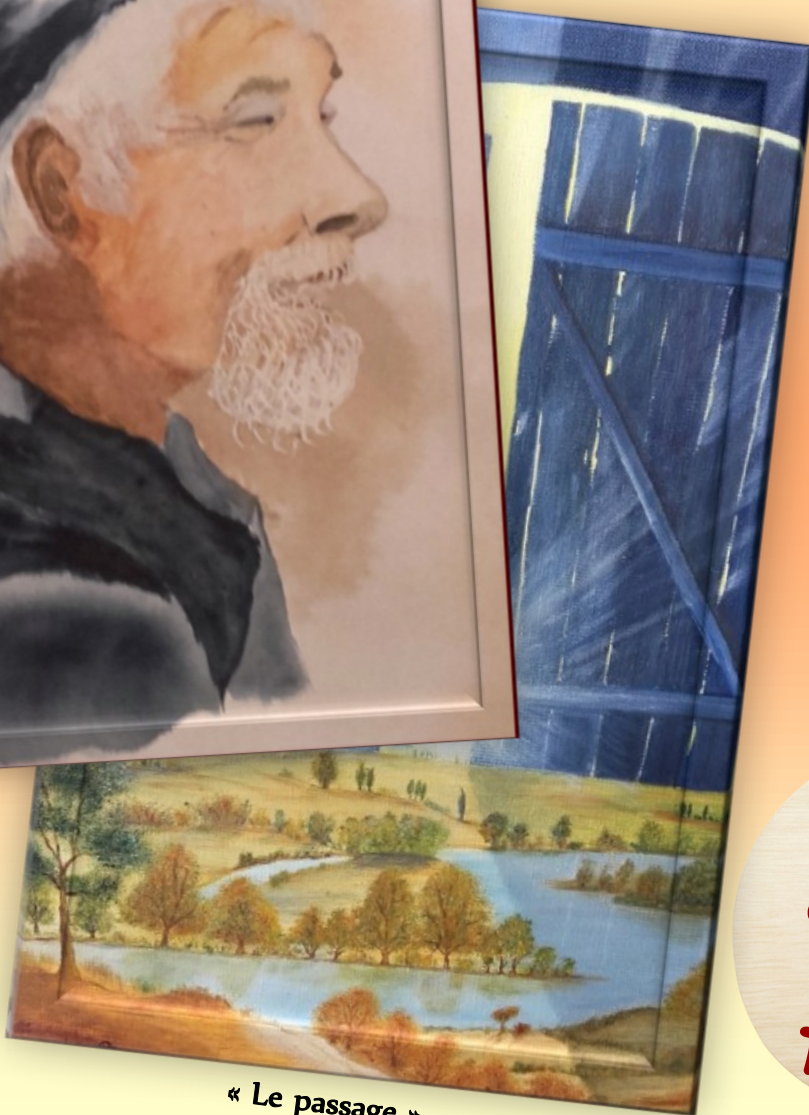
« Le passage »